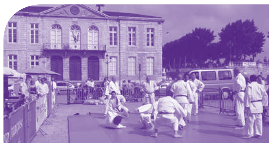
Le Pôle judo du Gers en pleine action

La deuxième édition de cette journée s'est déroulée à Auch sur la place de la mairie et non pas au hall du Mouzon, trop à l'écart du public. Une démonstration de judo adapté a été faite par le pôle judo Gers. Les judokas de nos établissements ont été très fiers de montrer aux passants, nombreux en ce samedi matin, leurs compétences en ce domaine. Ils ont reçu du Comité Départemental du Sport Adapté un superbe tee-shirt en récompense de leurs efforts.