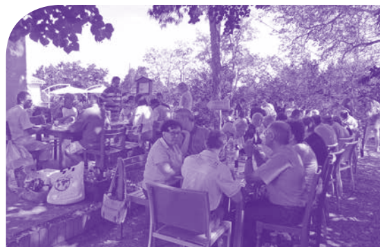
Le pique-nique sur la Terrasse

Les amateurs de danse ont pu ensuite se défouler grâce à l'animation musicale du groupe "Éclairs 3000" de l'ESAT d'Auch ■