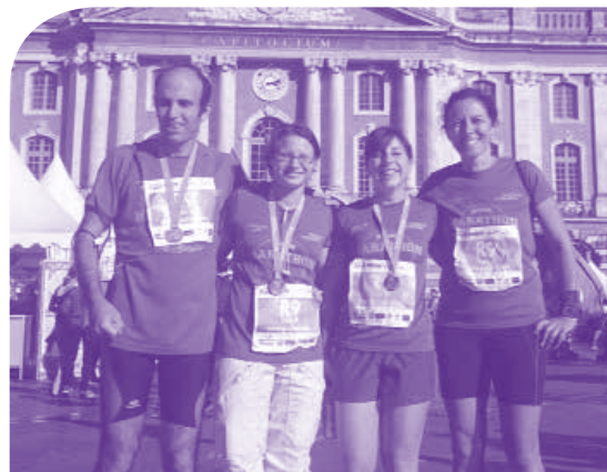
Les 4 runagapeistes

Temps inespéré, car ils ne pensaient pas le faire en moins de 4h... et mine de rien, deux minutes font toute la différence ! Ce fut un moment magique et émouvant pour chacun des relayeurs : le soleil radieux, l'extase de franchir ensemble la ligne d'arrivée sur la place du Capitole, l'ambiance festive de ces 42kms parsemés de groupes musicaux qui donnaient le rythme à nos enjambées et enfin la foule acclamant les coureurs !