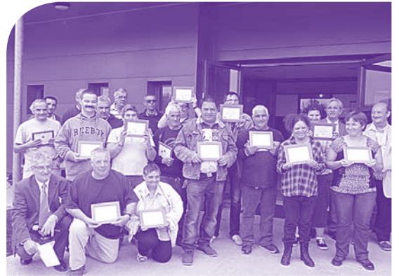
Le sourire des médaillés