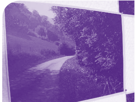
Un très beau travail de colorisation