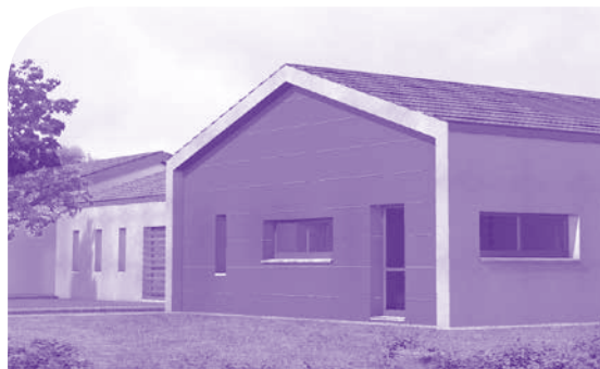
La belle "Villa bleue"

Ils ont réalisé tous les travaux de peinture de la Villa Bleue à Marciac. Ce chantier qui a duré 4 mois leur a permis de voir et de découvrir le rythme de travail des entreprises. Ils ont côtoyé d'autres corps de métier présents sur le chantier. Bonne expérience professionnelle pour toute l'équipe et plus particulièrement pour Adrien BLONDEEL qui a obtenu son titre professionnel de "Peintre en bâtiment" de niveau 5 ■