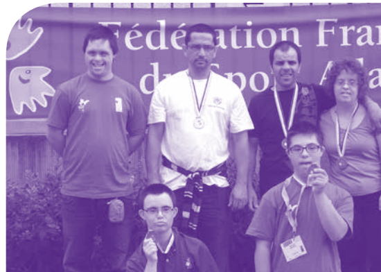
L'équipe des judokas en déplacement à Paris

Nous leur souhaitons une excellente nouvelle saison 2014/2015 avec toujours autant de plaisir et de motivation ! ■