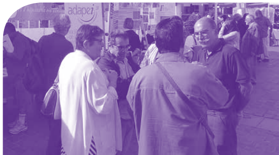
Le forum des associations, place du Capitole, a connu un franc succès, l'Adapei 31 y était très bien représentée.

Le public a répondu présent sur notre stand, (parents, professionnels, personnes en situation de handicap, simples curieux). Des contacts très utiles ont été pris sur place comme celui pris avec Monsieur le Président du Conseil de la CPAM de la Haute-Garonne. Nous avons pu échanger aussi avec un représentant de la CAISSE D'ÉPARGNE Midi-Pyrénées, avec de nouveaux élus de la ville de Toulouse et des représentants d'associations amies (DOMINO, TRISOMIE 21). Un grand merci à tous les bénévoles (administrateurs et bénévoles du club alouette) qui se sont succédés sur le stand ■