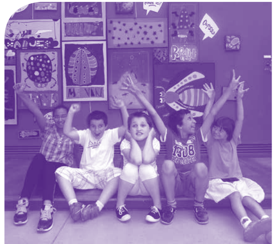
Les artistes en herbe

Une exposition qui s'est terminée autour d'un sympathique goûter offert par la direction du muséum ■