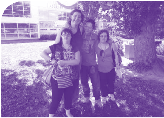
Nos champions de natation