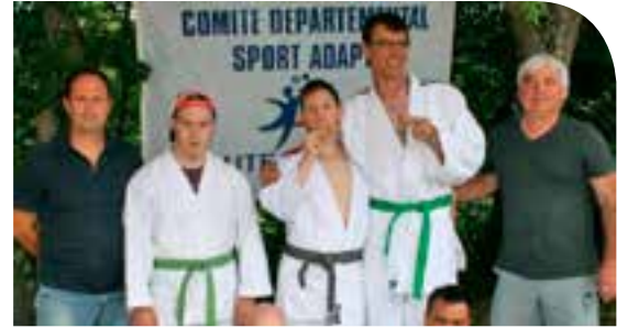
L'équipe des champions