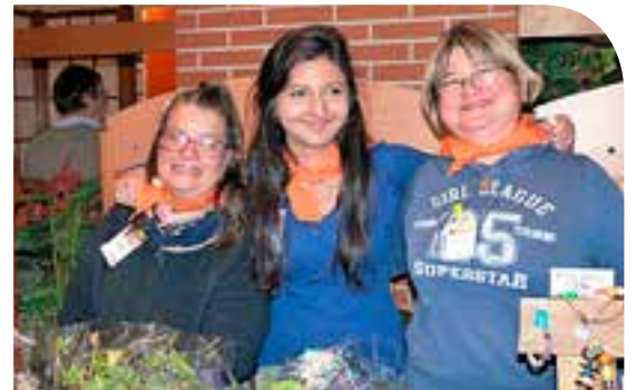
Une équipe soudée

Nous vendons des cartes de vœux, des petits bijoux, porte-clés, lampes, cadres, sculptures... soit des réalisations que nous faisons en soutien "Créations manuelles". Nous proposons aussi des compositions de fleurs et de plantes réalisées par des agents de l'atelier horticole (situé route de Miramont, à St Gaudens).