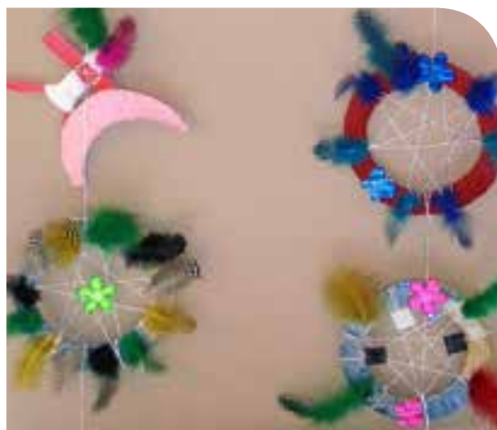
Le troisième prix