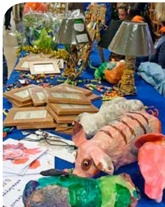
Le stand de l'ESAT

Remerciements à nos référentes pour leur implication, leur générosité et toutes leurs attentions.