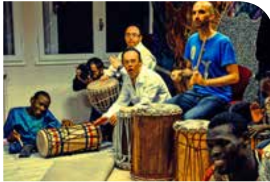
Rythme et énergie au Vignalis

Trois artistes guinéens sont venus en France dans le cadre de la Semaine de la Solidarité Internationale pour animer des temps d'échanges, présenter un spectacle et favoriser des actions de réciprocité.