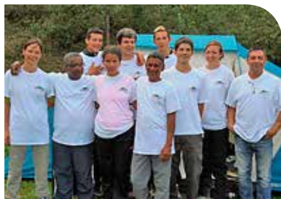
Lequipe du soutien de Fontenilles

L'équipe du Service soutien de Clermont-Capelas