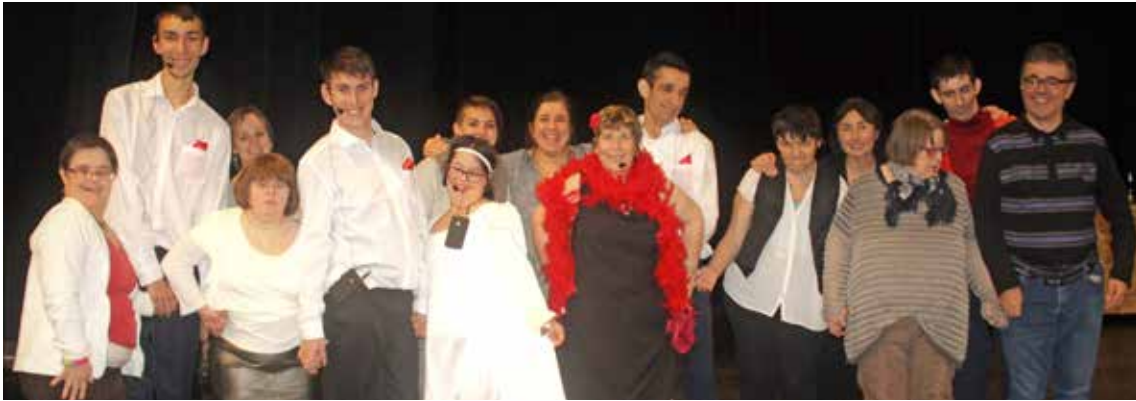
La troupe de théâtre et les figurants