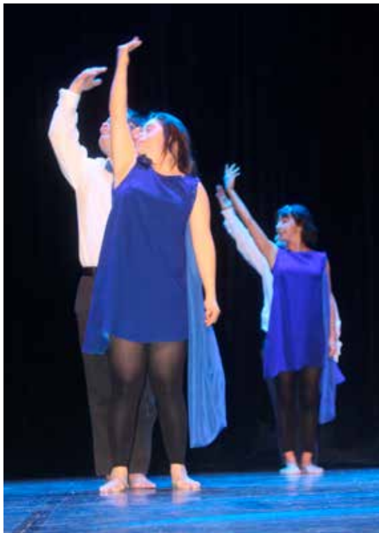
La grâce de la chorégraphie

L e choix de la tragédie Roméo et Juliette est lié à l'observation des comportements amoureux des jeunes du foyer de vie. Les relations amoureuses occupent une place importante dans leur quotidien, les émotions, les sentiments sont parfois mal contrôlés, l'amour/ l'amitié mal défini pour certains. On a pu travailler autour de ces thèmes avec eux (amour, amitié, haine). La comédie musicale de Gérard PRESBURVIC de 2001 et le film de 1996 de Baz LUHRMANN avec Leonardo Di Caprio et Claire Danes sur le texte original de Shakespeare leur ont été projetés afin qu'ils puissent mieux saisir l'histoire.