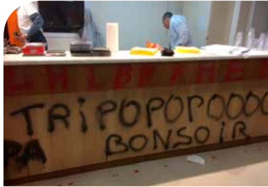
Ce soir on ferme !

Le foyer d'hébergement La Demeure-Vignalis dit "le Tripode" implanté à St-Orens depuis 1976, va (enfin!) être détruit pour laisser la place à une nouvelle structure. Les résidents ont donc quitté ce site et ont souhaité organiser une fête d'adieu en réalisant des graffs.