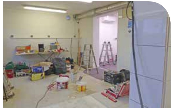
La laverie en chantier