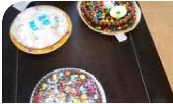
Les gâteaux en compétition

J'ai participé au concours interne de pâtisserie le 9 Janvier. Nous étions 4 candidats (Marie CABIRAN, Sébastien POILLOT, Céline JEANJEAN et moi). J'ai préparé un gâteau au yaourt garni de crème pâtissière avec un glaçage au chocolat blanc. J'étais super stressé pendant la préparation. Il y avait un jury composé de moniteurs et d'agents de production.