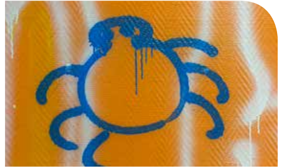
Histoire de punaises © Adapei 31