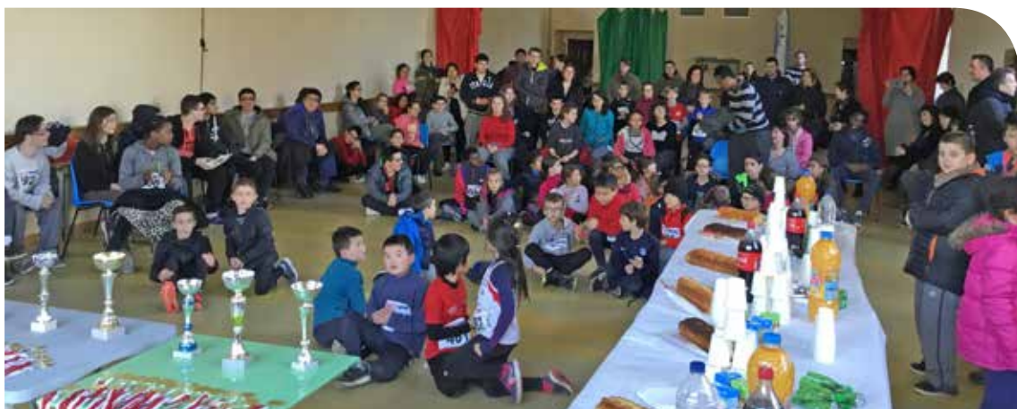
Après l'effort, le réconfort !

Près de 80 participants, venant de milieu ordinaire ou spécialisé, se sont élancés dans la course, chacun à son niveau, un, deux, trois ou quatre tours ! Un bel exemple de mixité. La journée a remporté un franc succès auprès de tout le monde ■