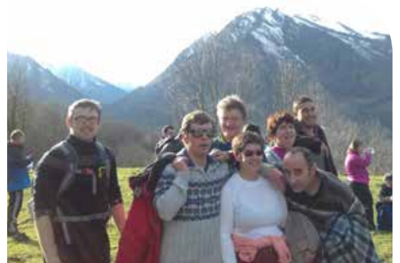
La vallée d'Aure au soleil