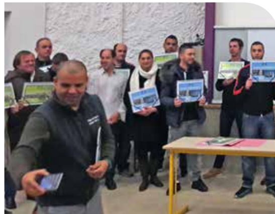
Remise des portefeuilles de compétences

À ce jour les sept candidats de l'ESAT Clermont Capelas présentés ont été reçus, et nous adressons