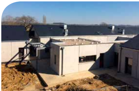
Le chantier du Jardin des constellations