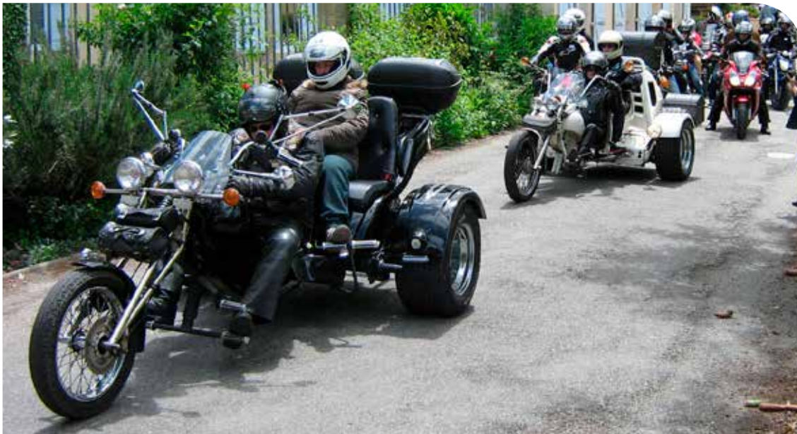
Bolides avec les vieilles bielles

C'est le 10 octobre 2018 à Espagnet que nous fêterons cet anniversaire. Le matin, est prévue l'inauguration des nouveaux locaux du FAM suivi d'un lunch. L'après-midi, il y aura une intervention des fondateurs de l'Association. Puis sera proposée une balade autour de l'établissement dans les voitures anciennes du Tacot