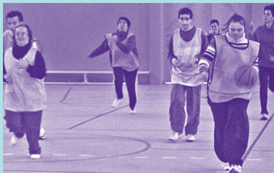
Une partie de basket

Toutes les sections du secteur adulte se retrouveront pour clôturer l'année sportive avec quelques-uns de leurs licenciés. Cette année ce transfert multi activités se déroulera à Bolquère près de Font Romeu avec comme thèmes : Aqua rando, Escalade, via ferrata, randonnée pédestre.