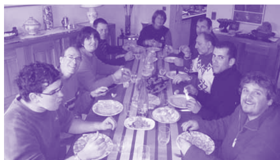
Après l'effort, le réconfort

deux clans ou villages voisins. Ici, nous avons d'un côté les travailleurs de l'ESAT et de l'autre le leylandis. A chaque fois, ce fut jeu gagnant pour les travailleurs de l'ESAT. Je rassure tout le monde, a été évité le jeu du "CABER" jeu écossais qui consiste à jeter le plus loin possible un énorme tronc