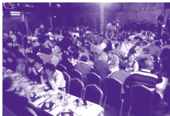
Noel au C'Moon Palace