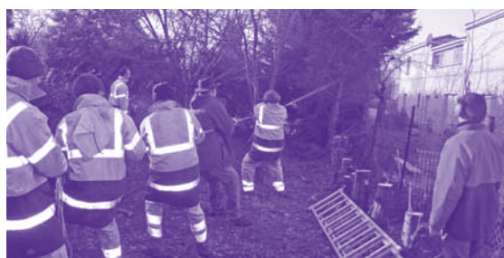
L'union fait la force

Élaguer, tailler, abattre une haie de 30 leylandis de plus de trois mètres de haut, broyer, évacuer les déchets tel fut le lot d'une équipe de l'atelier "espaces verts" de Clermont Capelas en ce début janvier. Quatre bonnes journées de travail où dans la bonne humeur il fallut faire preuve de technicité pour manier avec prudence la tronçonneuse, mais aussi calculer comment entailler l'arbre et contrôler sa chute pour le faire tomber du bon côté sans se le recevoir dessus. Par moment, le travail ressemblait fort au jeu écossais (tug of war) ou au jeu basque (soka tira) du tir à la corde où s'affrontent traditionnellement les équipes de